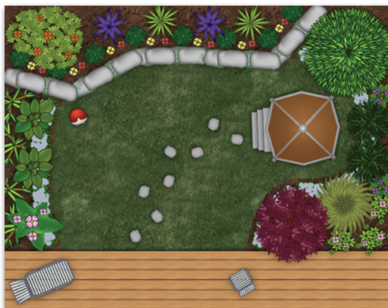
Figura 2.1: Esempio di giardino visto dall'alto.

L'area progettazione è raggiungibile dall'area riservata (profilo) di ciascun cliente e si occupa di memorizzare tutte le informazioni che i clienti forniscono circa i settori da progettare (quindi prive di piante) dei loro spazi verdi. In base a queste informazioni, il sistema fornisce suggerimenti su quali piante possono effettivamente essere messe a dimora nei vari settori del giardino del cliente sia in base alle necessità di queste che dal punto di vista economico. Nell'area